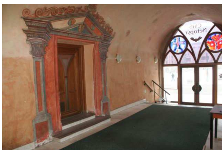
Obr. č. 2 - Pohled z hlavní chodby na vchod do zájmového prostoru.