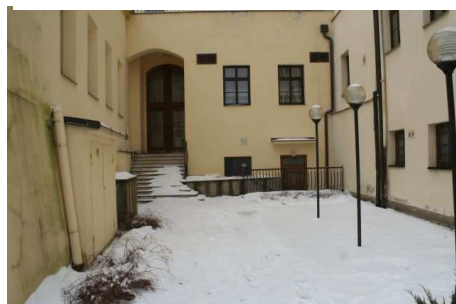
Obr. č. 6 - Pohled na zadní vchod pro zásobování.