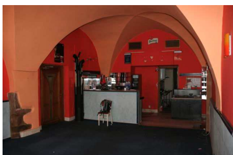
Obr. č. 4 - Pohled na prodejní prostor směrem k zázemí.