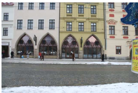
Obr. č. 1 - Celkový pohled na fasádu a hlavní vchod. Zájmový prostor je 1. portál zprava.

Kamila Gebrtová, kamilagebrtova@fabes.cz , +420 775 570 366