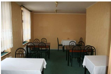
Obr. č. 5 - Pohled na zázemí.